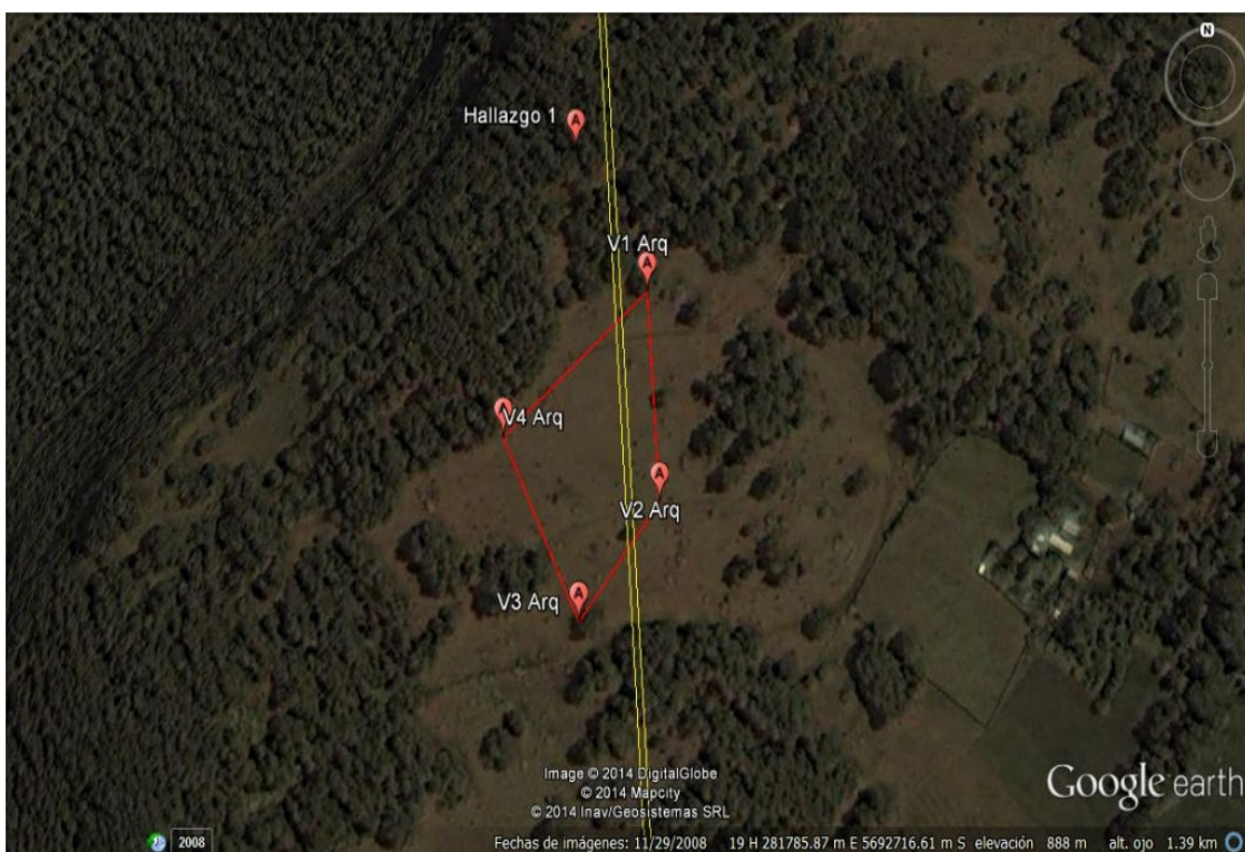
Figura 1. Polígono del área donde se registró material arqueológico en superficie. Las líneas amarillas corresponderían a la tubería forzada proyectada, la cual se emplaza en el punto medio de la faja de servidumbre que mide 20 m. de ancho. El hallazgo 1, se encuentra 60 m. más al norte del vértice 1 del polígono por la faja de servidumbre (Reproducido de fs. 152).

TRIGÉSIMO PRIMERO. Ante este requerimiento del CMN, la Empresa propuso prospectar sólo el 20% del área de servidumbre y modificó el polígono correspondiente al sitio arqueológico (Figura 2).