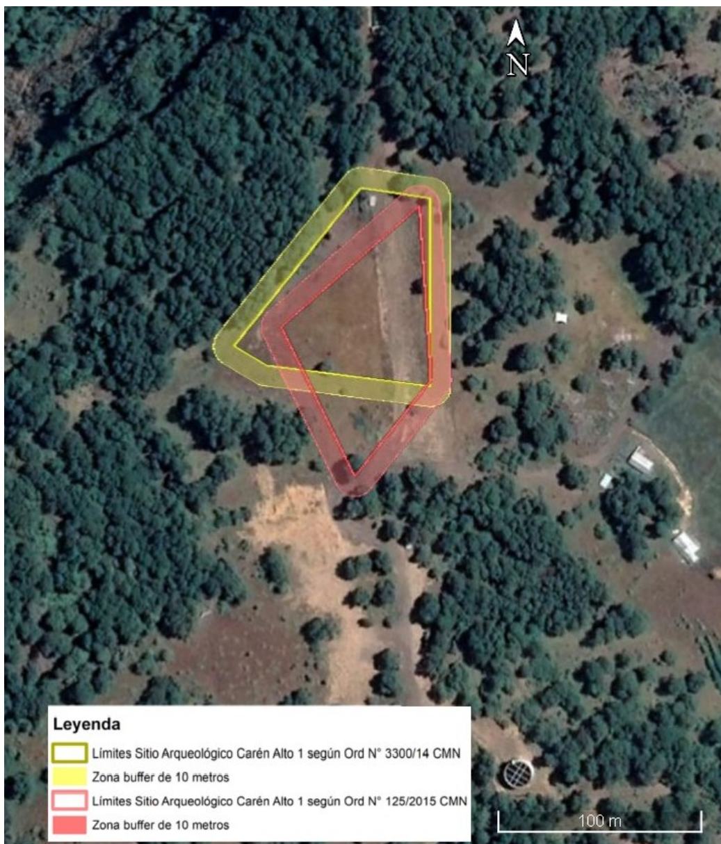
Figura 3: Representación de los polígonos que podrían definir el Sitio Arqueológico Carén Alto 1, con sus respectivos buffer de 10 metros (Elaborado por el Tribunal en base a los antecedentes de los oficios evacuados por el CMN de fs. 515 y fs. 701).

TRIGÉSIMO SÉPTIMO. De esta forma, a partir de la información contenida en los documentos analizados previamente, el Tribunal llega a la conclusión que el Sitio Arqueológico Carén Alto 1 no se encuentra claramente delimitado, habiéndose pronunciado el CMN de modo favorable respecto de un polígono de 5 vértices, que tiene una superficie de 4.500 m 2 y que fue definido en consideración a la densidad de hallazgos arqueológicos, y también por otro de cuatro vértices, a juzgar por la figura 1 (presentada por la Demandada, recibida conforme por el CMN).