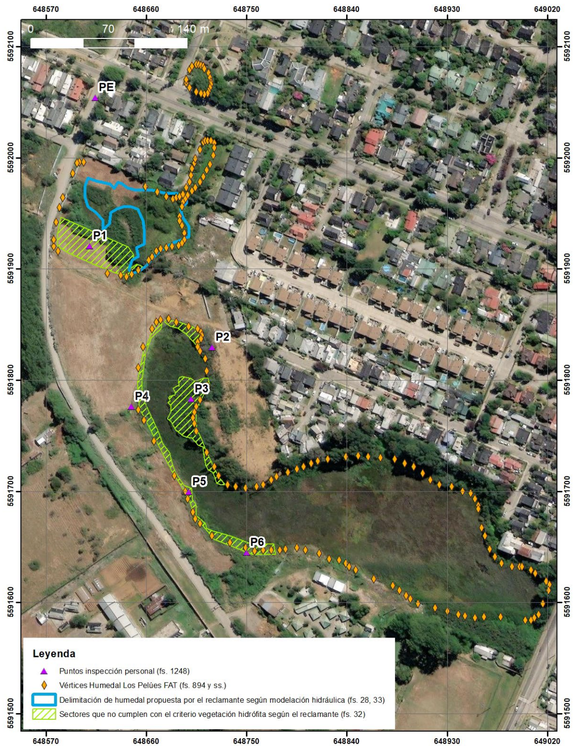
Figura 3. Superficie reclamada en base al criterio de vegetación hidrófita y régimen hidrológico. También se presentan los puntos inspeccionados por el Tribunal. Elaboración propia, en base a Acta de inspección personal fs. 1248; vértices del "Humedal Los Pelúes" según Ficha Técnica (fs. 894 y ss.); sectores que no cumplen con el criterio de vegetación hidrófita según el reclamante presentados en la imagen 14 de la reclamación (fs. 32) y delimitación propuesta de delimitación de "Humedal Los Pelúes" por el reclamante, según modelación hidráulica, presentados en la imagen 13 de la reclamación (fs. 28, 33). Proyección WGS84 DATUM 18S.

sentan de mejor manera la delimitación del "Humedal Los Pelúes".