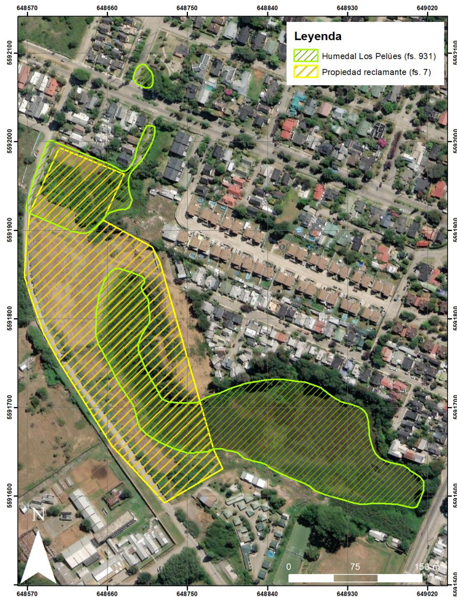
Figura 2. Superposición de la superficie del "Humedal Los Pelúes" con la propiedad de Inmobiliaria Tejas Sur Ltda. Elaboración propia en base a Imagen N°2 de la Reclamación (fs. 7) y el polígono oficial de declaración del Humedal Sistema de humedales urbanos sector Isla Teja (fs. 931). Proyección WGS84 DATUM 18S.

QUINCUGÉSIMO CUARTO. Que, de acuerdo con las alegaciones de la Reclamante, ella es propietaria de seis lotes ubicados en, o en las proximidades, del polígono definido para el "Humedal Los Pelúes", existiendo una superposición entre ambos según se presenta en la Figura 2.