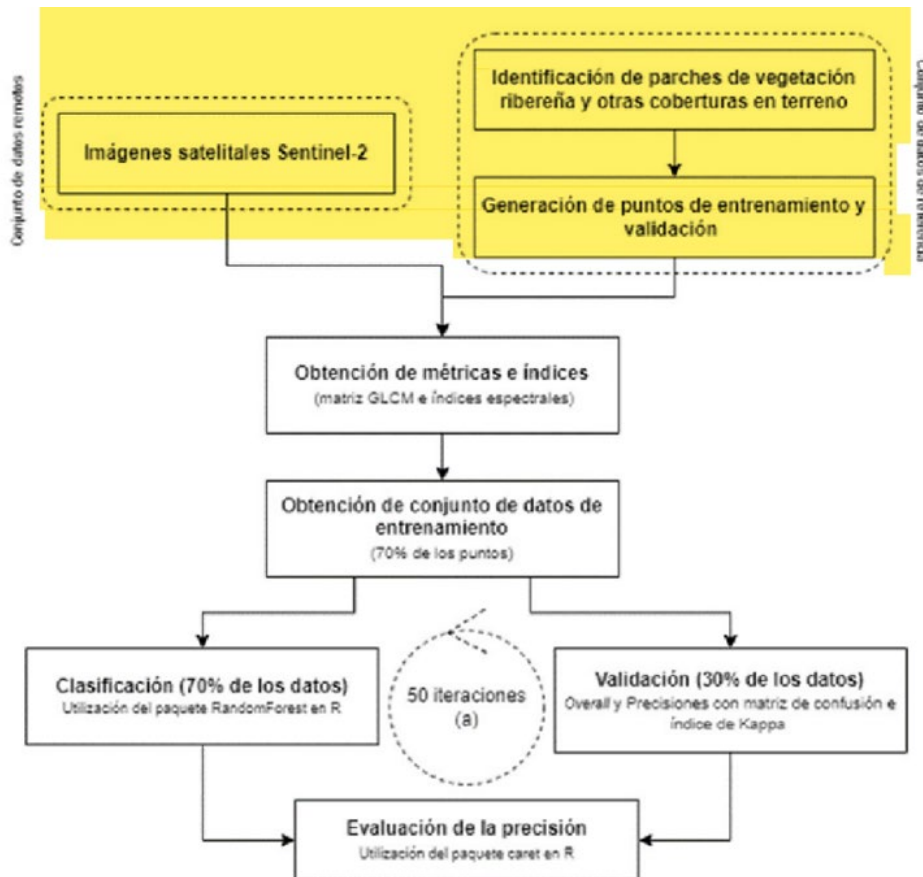
Figura N°3: Flujograma metodológico para la elaboración del mapa de coberturas de uso del suelo (adaptado de Michez et al., 2016).

estudio realiza un modelo digital de elevación y una clasificación del hábitat a través de interpretación de imágenes satelitales cuya caracterización se efectúa a través de la metodología de Michez et al. (2016), para clasificar vegetación ribereña con herramientas de machine learning, las cuales se encuentran descritas por Lopatin et al. (2019) y Fassnacht et al. (2021). En el siguiente diagrama se observa la metodología que indica que se utilizó (lo destacado es del Tribunal).