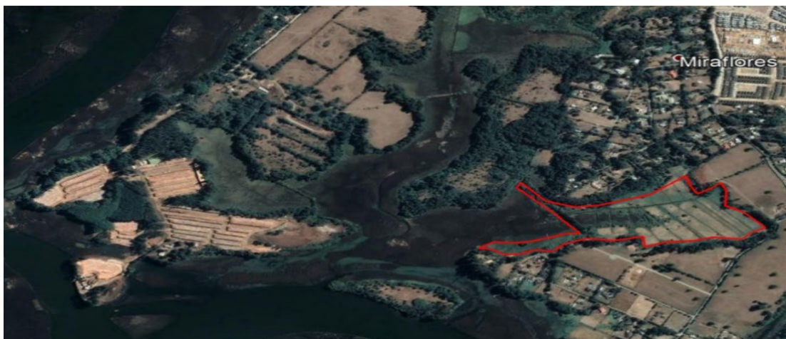
Figura 2. Imagen de fs. 231 que presenta el terreno indicado por la Sra. Haverbeck como destinado a la producción silvoagropecuaria.

QUINCUAGÉSIMO OCTAVO. Que, según consta a fs. 231, el 14 de junio de 2021, la Sra. Haverbeck envía una carta a la SEREMI. En este documento se individualiza una porción del predio definido, con una superficie de 12 ha, que estaría siendo incluida dentro de los límites del humedal propuesto por la Municipalidad de Valdivia. Señala que estas 12 ha se encuentran destinadas a producción silvoagropecuaria, por lo que serían erróneamente definidas como humedal dado que no es un área inundada " desde hace más de 134 años " (fs. 232). A continuación, se incorpora la imagen de fs. 231 que da cuenta de dicha superposición.