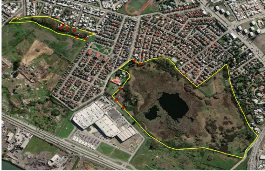
Figura 3: Actividades en terreno 11/07/2022 - Puntos de muestreo.

o corregir los límites originales del humedal. Incluye la caracterización de 11 puntos de muestreo, indicando criterio de delimitación registrado en cada punto.