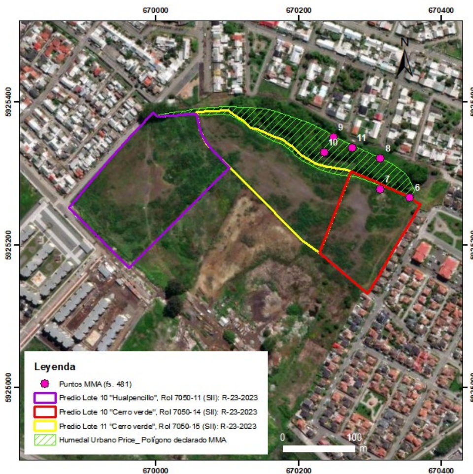
Figura 7: Puntos de muestreo asociados a predios de las Reclamantes causas R-23-2023.

VIGÉSIMO SÉPTIMO. Además, se pudo verificar que la ficha técnica cuenta con descriptores específicos para cada uno de los elementos que permiten delimitar un humedal (fs. 528): i) Indicadores hidrología: Registros indicadores grupo A1: Agua superficial, A2: Nivel freático alto, Grupo B7: inundación visible en imágenes aéreas, y Grupo C8: Madrigueras de camarones; ii) Indicadores de suelo hídrico: Se delimitó a través del indicador rasgos redoximórficos dentro de los 30 cm. y 40 cm. superiores, así como, rizósferas oxidadas, y colores gley dentro de los primeros 45 cm.; iii) Indicadores de vegetación hidrófita: Dominancia de especies hidrófitas y/o helófitas, como Cyperus eragrostis (Cortadera), Schoenoplectus californicus (Totora), Carex chilensis (Cortadera azul), Carex brongniartii (Cortadera), Juncus procerus (Junquillo), Juncus effusus (Junquillo), Typha angustifolia (Vatro), Ludwigia peploides (Clavito de agua), Veronica anagallis-aquatica (No me olvides del campo), Salix viminalis (Sauce mimbre), Alisma plantago-aquatica (Llantén de agua), entre otros.