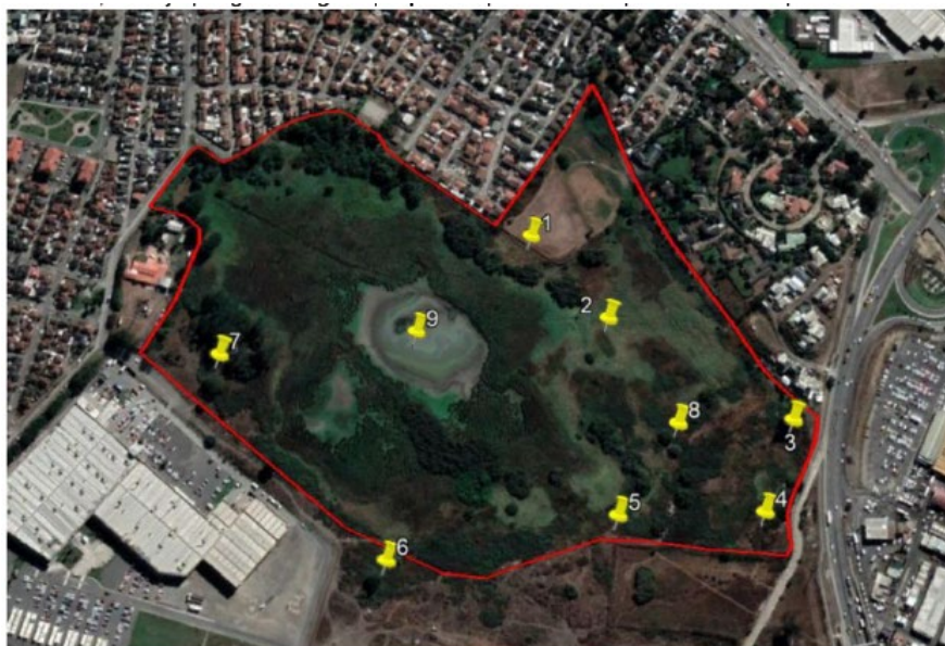
Figura 2: Actividades en terreno 18/03/2022 - Puntos de muestreo.