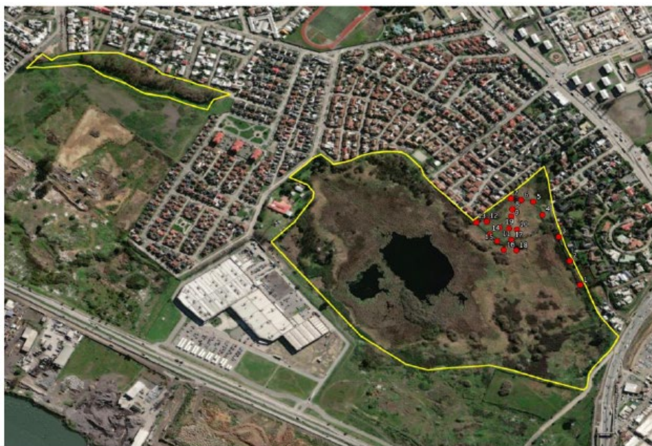
Figura 4: Actividades en terreno 09/08/2022 - Puntos de muestreo.

8) A fs. 488, acta de Visita a Terreno al humedal urbano Price, de 9 de agosto de 2022, por parte de profesionales de la Seremi de Medio Ambiente y del Departamento de Ecosistemas Acuáticos del MMA, con la finalidad de ratificar o corregir los límites originales del humedal. Incluye la caracterización de 19 puntos de muestreo, indicando criterio de delimitación registrado en cada punto.