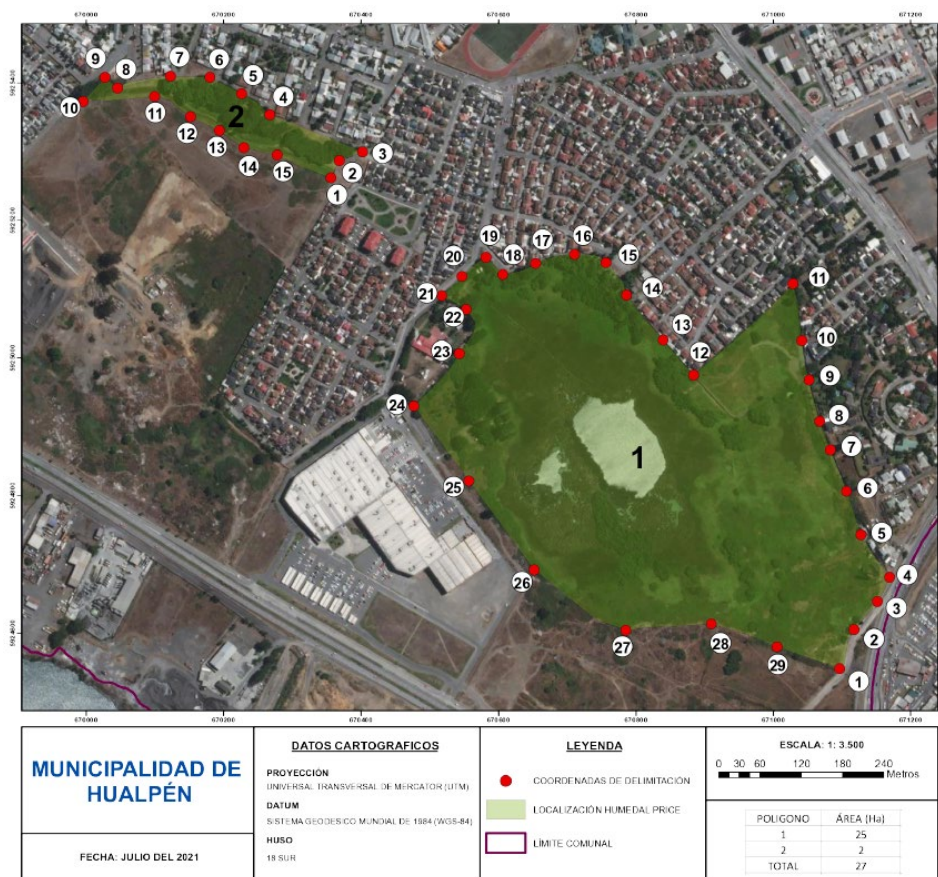
Figura 1: Cartografía Humedal solicitado por la Municipalidad de Hualpén. Fuente: fs. 317 y 318.