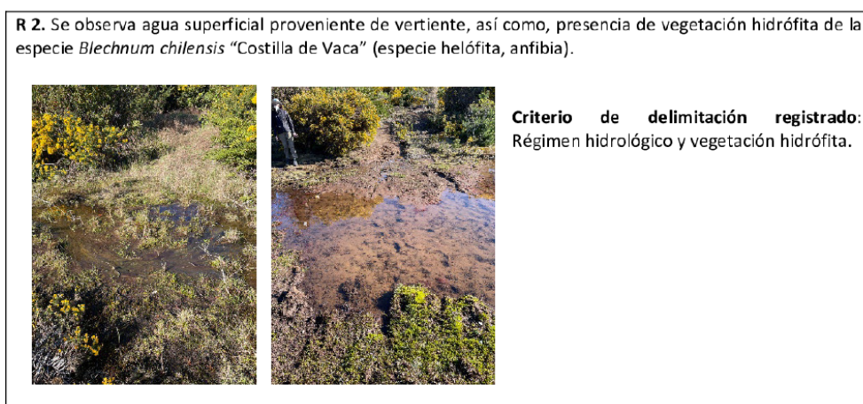
Figura 4. Condiciones ambientales constatadas en terreno.

CUADRAGÉSIMO SEGUNDO. Que, de acuerdo con las descripciones realizadas y las fotografías presentadas, se puede indicar que la evaluación de criterios para determinar la existencia de humedal, se basó en la presencia de canales, agua superficial (suelo saturado) y vegetación hidrófita, dada la "dominancia" del helecho Blechnum chilense ("costilla de vaca"), principalmente. Pero las imágenes que darían cuenta de la "dominancia" de dicha especie, no contienen ni un sólo ejemplar de la misma, como se observa a continuación (Figuras 4 y 5):