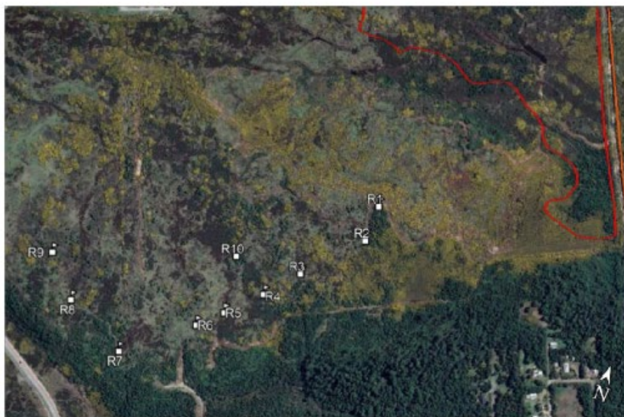
Figura 3. Puntos evaluados por profesionales del MMA, en rojo polígono de humedal propuesto.

Imagen 2: Zona evaluada en terreno en terreno día 08 de octubre del 2021. Se identifican en mapa ubicación de registros fotográficos georeferenciados, individualizado como R1 a R10. En rojo el polígono de la propuesta original.