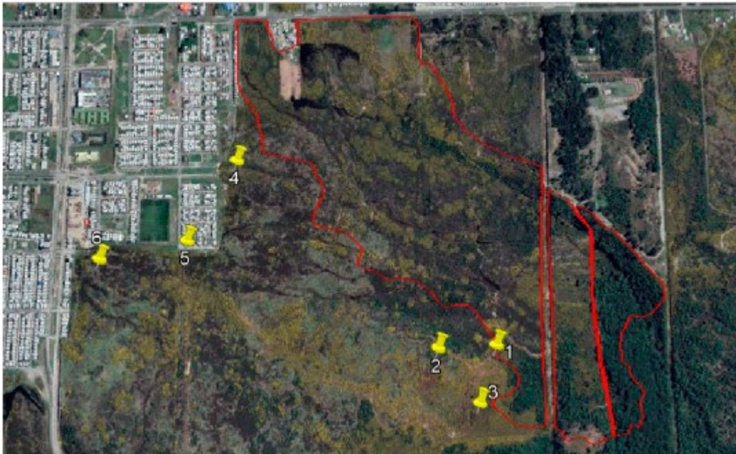
Figura 1. Puntos evaluados por profesionales del MMA, fuera del polígono propuesto.

TRIGÉSIMO QUINTO. Que, en dicho documento, luego se presenta la tabla de evaluación de los criterios de delimitación para seis puntos (Puntos 1, 2, 3, 4, 5 y 8) (fs. 668). Para estos puntos se realiza una breve descripción del ambiente, mencionando pendiente (topografía), capacidad de infiltración del suelo y vegetación dominante. En virtud de lo anterior, se indica si el sector cumple o no con alguno de los criterios de delimitación. Como resultado de esta evaluación, sólo el punto 8 cumple con alguno de los criterios de delimitación, pero, como ya se indicó, éste no está representado en la imagen. Asimismo, menciona que en el punto 4 se constató presencia de suelo saturado y dominancia de la especie costilla de vaca, Blechnum chilense (especie helófito), por lo que, en la delimitación final, se excluye sólo la zona que no cumple con los criterios de delimitación, que correspondería a lomajes con dominancia de Ulex europaeus (espinillo).