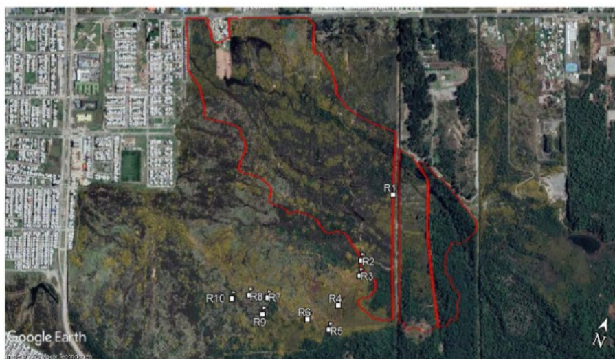
Figura 2. Puntos evaluados por profesionales del MMA, en rojo polígono de humedal propuesto.