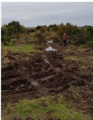
Figura 5. Condiciones ambientales constatadas en terreno. Fuente: Extracto de Tabla de Caracterización de los puntos de muestreo realizado el viernes 08 de octubre del Informe Visita a terreno Humedal Rupallán (fs. 658).

Punto 2 Se observa suelo con saturación de agua mantenido por una vertiente que escurre por zona de menor pendiente, además, de la dominancia de vegetación hidrófita de Blechnum chilense "Costilla de Vaca" (especie helófito, anfibio). Criterio de delimitación registrado: Régimen hidrológico y vegetación hidrófita.