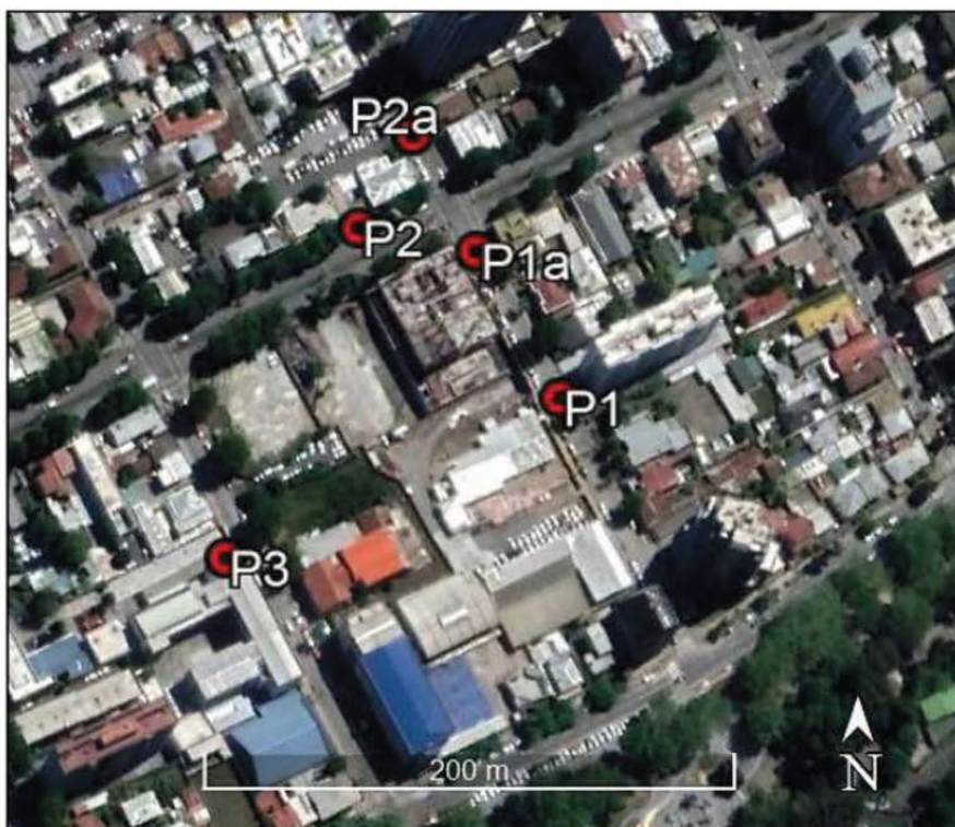
Figura 2. Posiciones de medición de ruido del día 13 de abril de 2022.

A partir de las mediciones realizadas, establece los siguientes resultados (fs. 563)