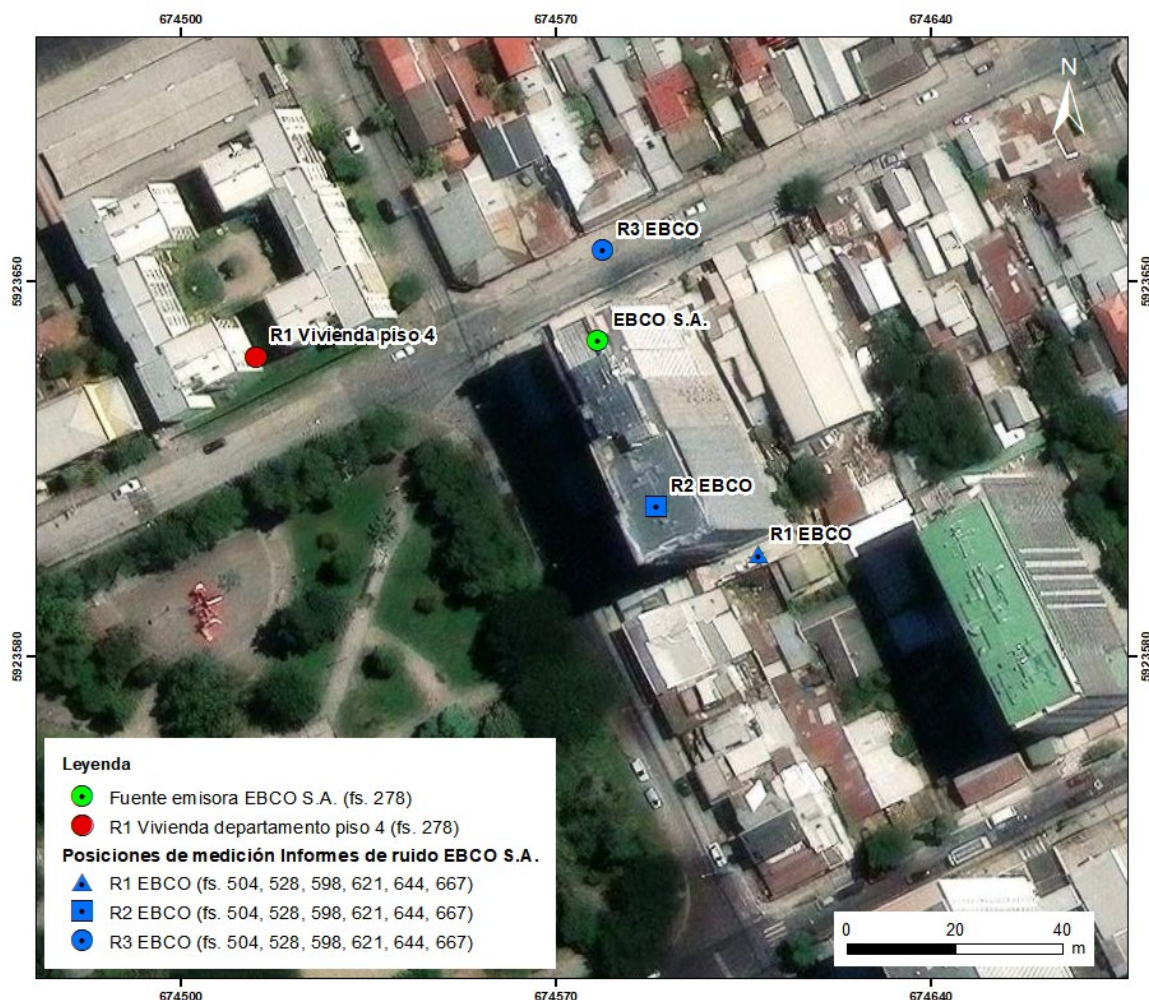
Figura 3: Ubicación de la unidad fiscalizable "EBCO S.A", el receptor de ruido "R-1" (denunciante, en marcador rojo) y los receptores R1, R2 y R3 del monitoreo de ruido (en marcadores azules). En marcador verde se observa la unidad fiscalizable; en marcador rojo, el domicilio del denunciante y los marcadores azules corresponden

VIGÉSIMO TERCERO. Sobre este punto, tras la revisión de los informes de monitoreo de ruido presentados por la empresa (fs. 494, 518, 588, 612, 635 y 658, que corresponden a septiembre, noviembre, diciembre de 2024, enero, febrero y marzo de 2024, respectivamente), se observó que los receptores medidos (R1, R2 y R3) no corresponden al receptor sensible donde se acreditó el incumplimiento de la norma. Además, en todas las mediciones se mantuvo la misma ubicación de los tres receptores medidos (mismas coordenadas). En la Fig. 3 se presenta la ubicación de los receptores monitoreados por EBCO, y la ubicación del receptor donde ocurrió el incumplimiento.