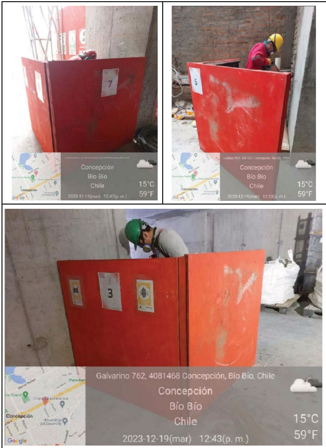
Figura 2: Fotografías aportadas por el titular en el PDC sobre los biombos instalados.

diferente numeración, lo que permite entender que el infractor no cumplió con la cantidad de biombos comprometidos. Esto se puede apreciar en las fotografías entregadas por el titular (Fig. 2).